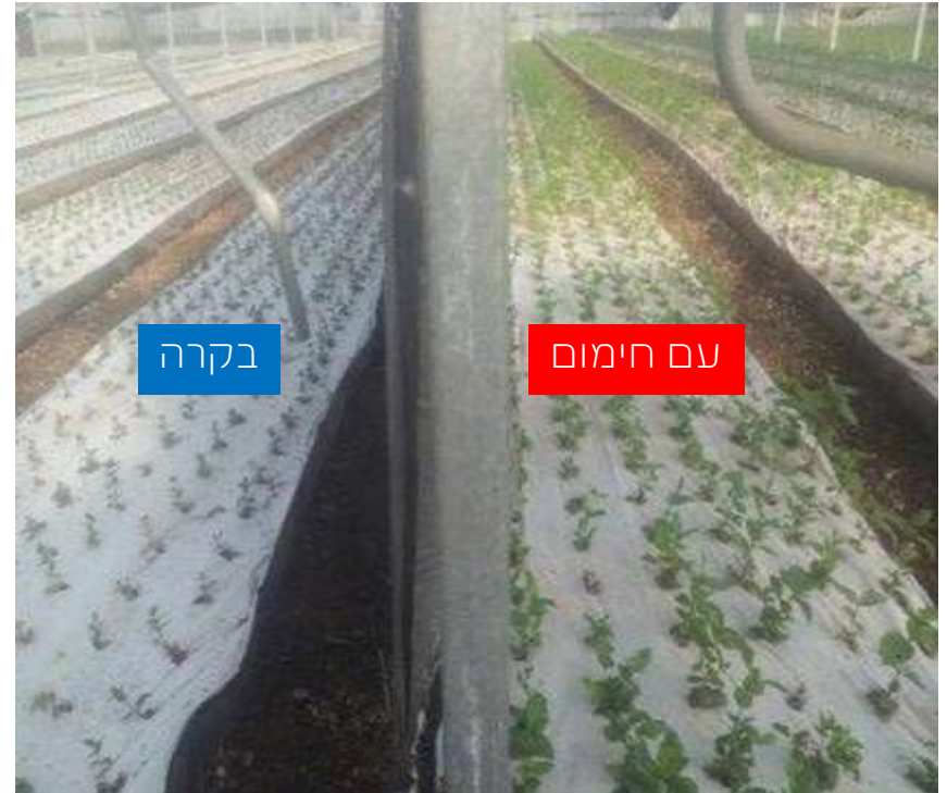
לאחר שבועיים ערוגה שמאלית - ביקורת ערוגה ימנית - עם חימום