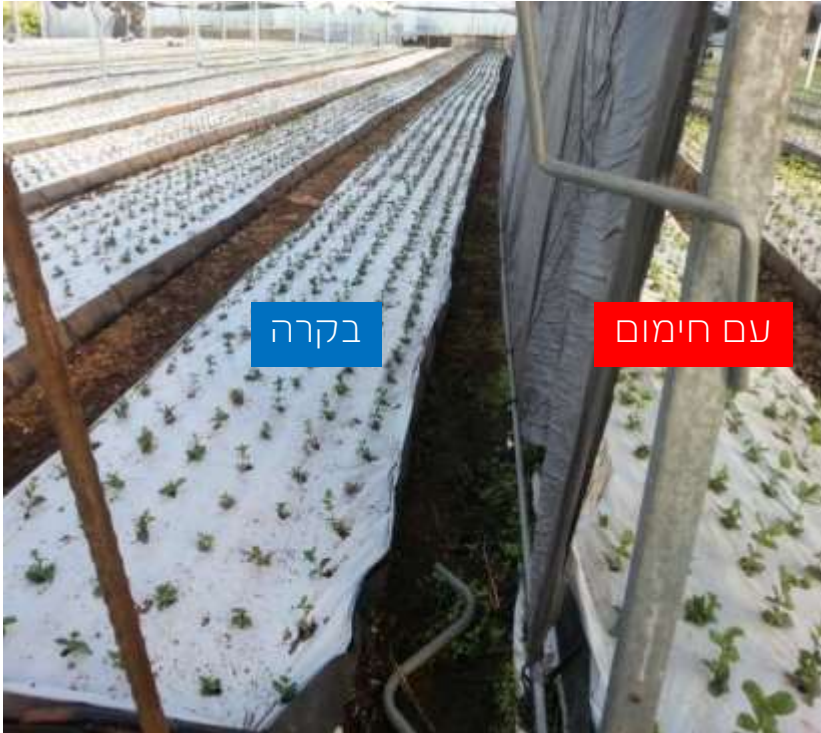
23 בדצמבר 2013 ערוגה שמאלית - ביקורת ערוגה ימנית - עם חימום